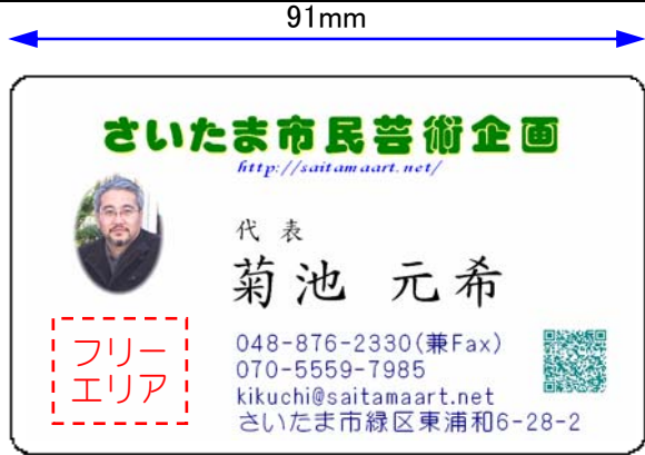
▲表面(情報面)の基本レイアウト